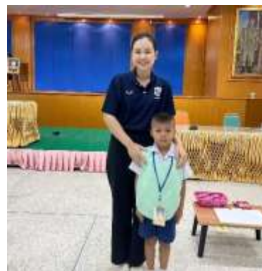
ภาพการเข้าร่วมการแข่งขัน