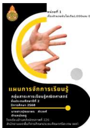
แผนการจัดการเรียนรู้