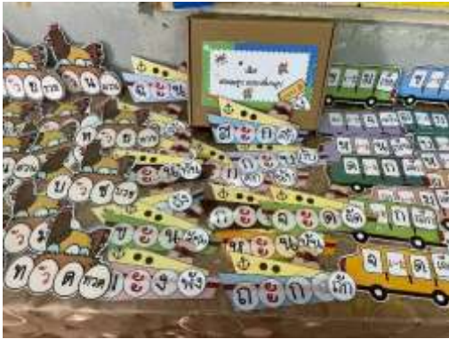
ภาพสื่อการเรียนรู้

ครูเลือกใช้สื่อและเทคโนโลยีที่หลากหลายและเหมาะสมกับวัยและศักยภาพของผู้เรียน เช่น สื่อสิ่งพิมพ์ สื่อดิจิทัล สื่อออนไลน์ แหล่งเรียนรู้ภายในและภายนอกสถานศึกษา เพื่อสร้างแรงจูงใจและส่งเสริมการเรียนรู้ด้วยตนเอง รวมถึงเปิดโอกาสให้ผู้เรียนแสวงหาความรู้เพิ่มเติมจากแหล่งเรียนรู้ในชุมชนและท้องถิ่น ทำให้เกิดการเรียนรู้อย่างต่อเนื่องและมีประสิทธิภาพ