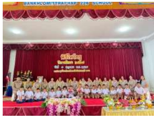
กิจกรรมวันไหว้ครู