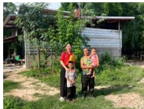
ภาพการให้ข้อมูลป้อนกลับแก่ผู้เรียนและผู้ปกครอง