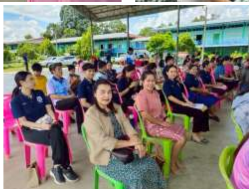
ภาพการเข้าร่วมอบรม/ประชุม/สัมมนา