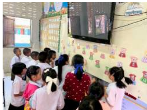
ภาพบรรยากาศในชั้นเรียน