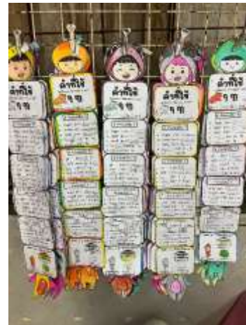
ผลงานนักเรียน