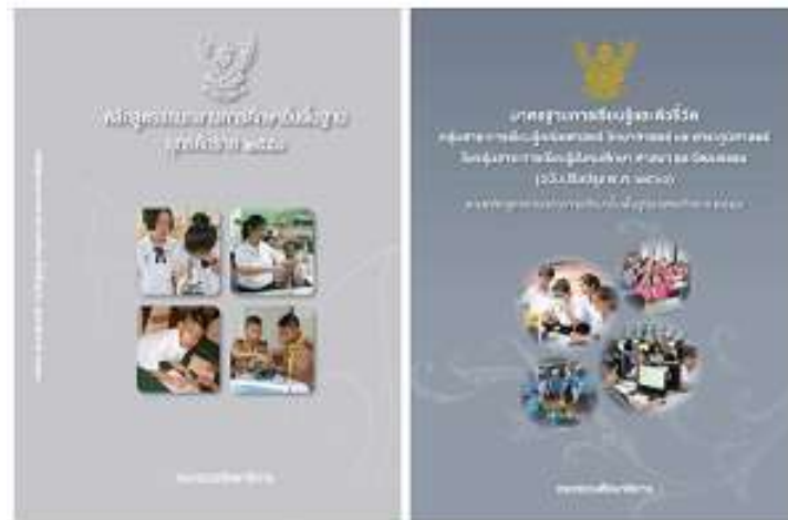
หลักสูตรแกนกลางการศึกษาขั้นพื้นฐาน

ครูออกแบบและจัดกิจกรรมการเรียนรู้ที่เน้นผู้เรียนเป็นสำคัญ โดยใช้กระบวนการเรียนรู้เชิงรุก (Active Learning) ส่งเสริมให้ผู้เรียนได้ฝึกคิด วิเคราะห์ แก้ปัญหา และลงมือปฏิบัติจริง ผ่านกิจกรรมที่สอดคล้องกับชีวิตประจำวันและบริบทของท้องถิ่น ผู้เรียนสามารถเชื่อมโยงความรู้ที่ได้รับไปประยุกต์ใช้ในชีวิตจริงได้อย่างเหมาะสม นำไปสู่การพัฒนาสมรรถนะและคุณลักษณะที่พึงประสงค์ตามหลักสูตรแกนกลาง การศึกษาขั้นพื้นฐาน นอกจากนี้ ครูยังออกแบบแผนการจัดการเรียนรู้ที่สอดคล้องกับหลักสูตรแกนกลาง การศึกษาขั้นพื้นฐาน และหลักสูตรสถานศึกษาที่พัฒนาขึ้นตามบริบทของโรงเรียนและชุมชน โดยคำนึงถึง ความแตกต่างระหว่างบุคคล ความสนใจ และความต้องการของผู้เรียน เพื่อให้ผู้เรียนได้พัฒนาสมรรถนะหลัก คุณลักษณะอันพึงประสงค์ และค่านิยมที่พึงประสงค์อย่างต่อเนื่อง