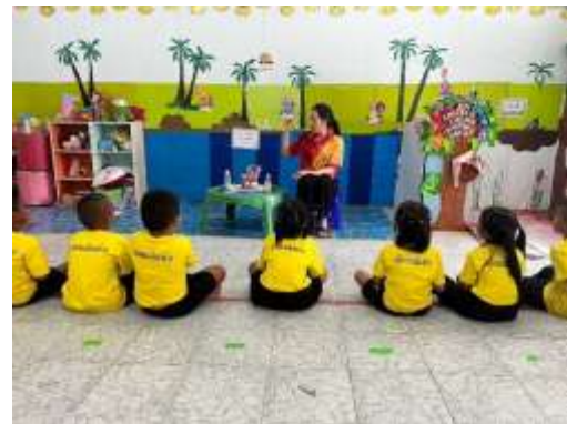
การจัดการเรียนการสอน ชั้นประถมศึกษาปีที่ 2