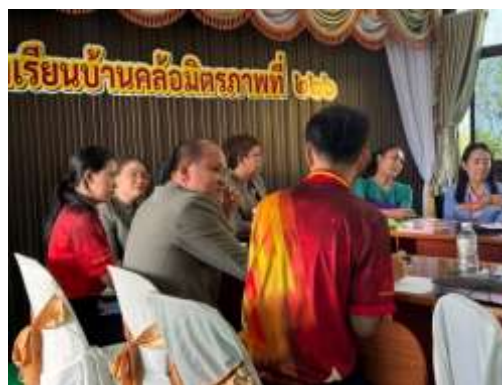
ภาพกิจกรรมชุมชนแห่งการเรียนรู้ทางวิชาชีพ (PLC)