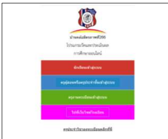
โปรแกรมวัดผลและประเมินผลออนไลน์