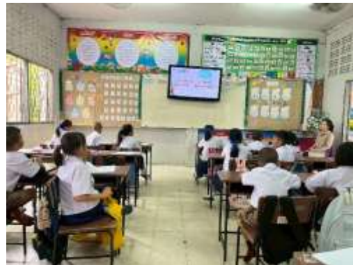
ภาพการใช้สื่อ เทคโนโลยีสารสนเทศ และแหล่งเรียนรู้ที่เอื้อต่อการเรียนรู้