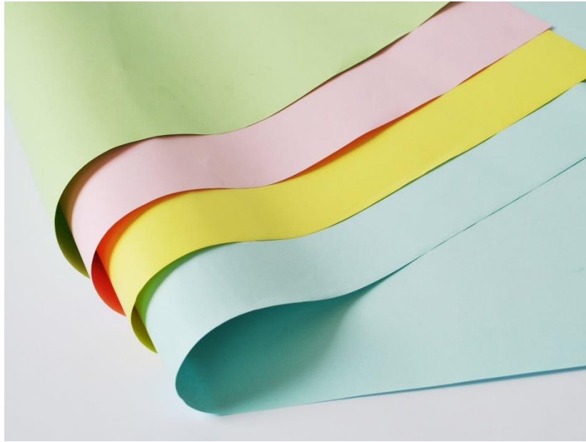
กระดาษชาร์ตสี แผ่นใหญ่