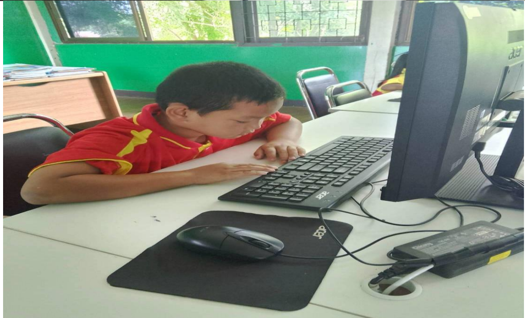
นักเรียนชั้นป.๑ เรียนรู้เทคโนโลยี ด้านคอมพิวเตอร์