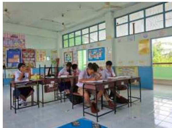
การจัดการเรียนการสอนรายวิชาภาษาอังกฤษ ชั้นมัธยมศึกษาปีที่ 1-3