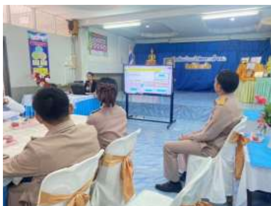
ภาพการเข้าร่วมอบรม/ประชุม/สัมมนา