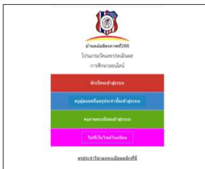
โปรแกรมวัดผลและประเมินผลออนไลน์