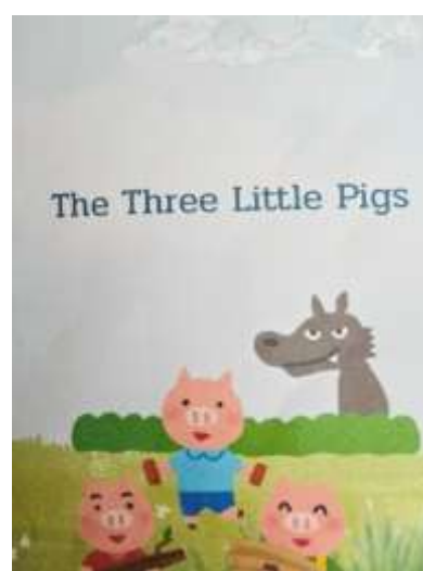
ภาพสื่อการเรียนรู้