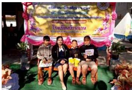
ภาพการเข้าร่วมการแข่งขัน