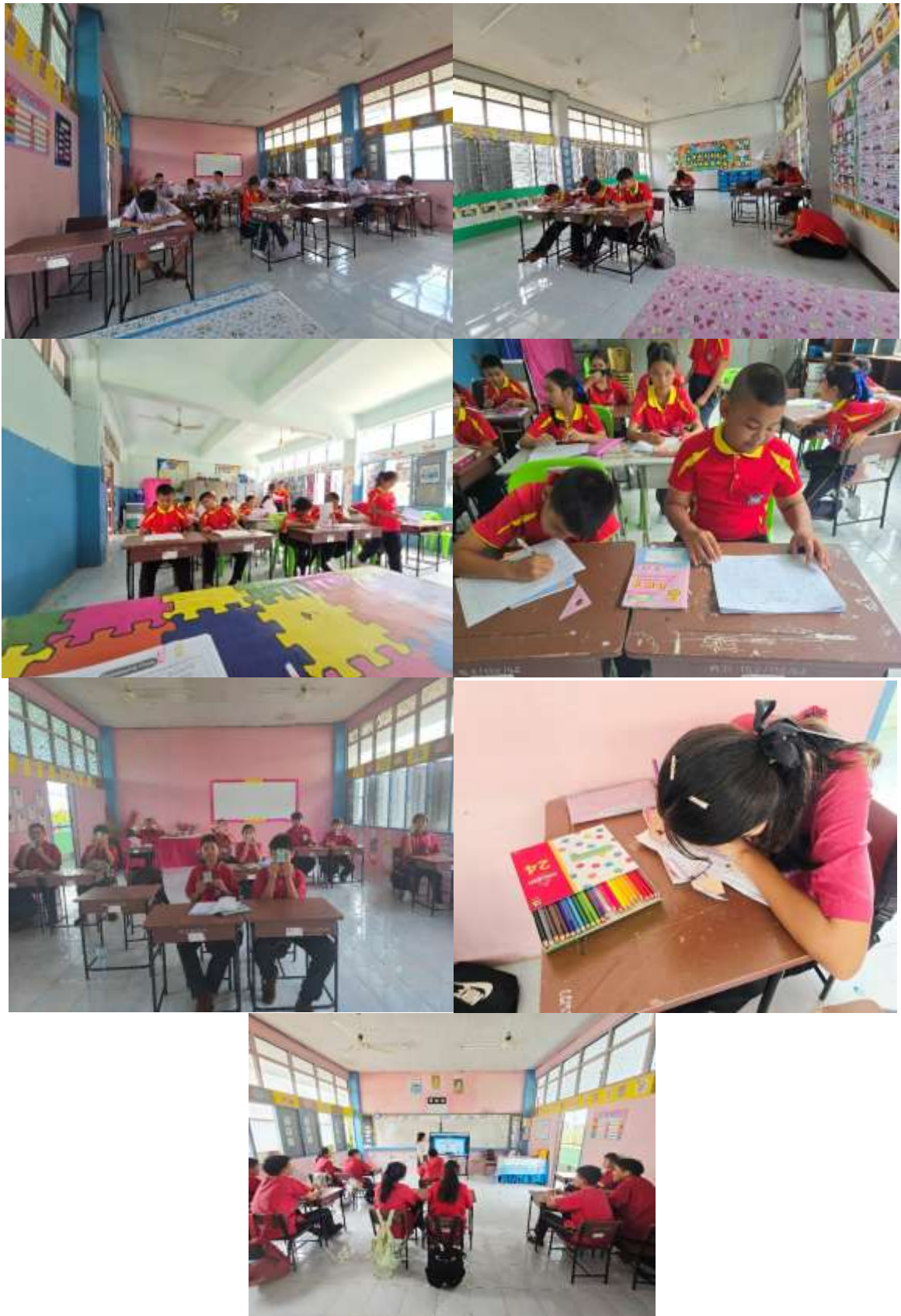
ภาพบรรยากาศในชั้นเรียน