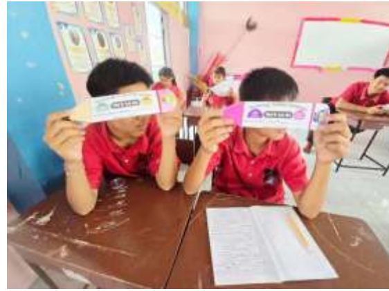
ภาพสื่อการเรียนรู้