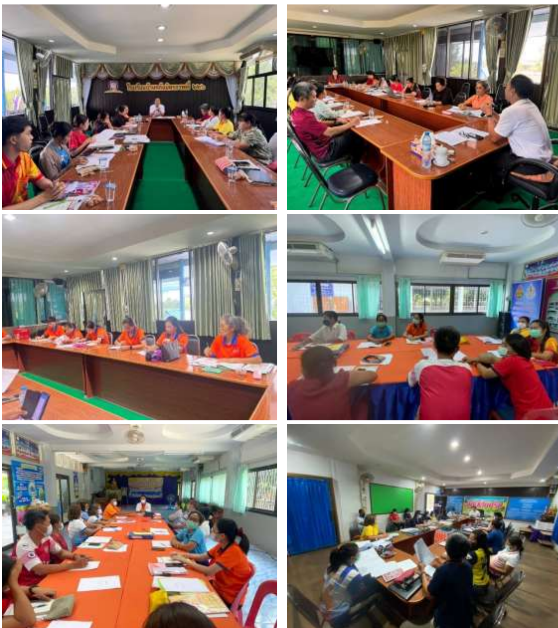
ภาพกิจกรรมชุมชนแห่งการเรียนรู้ทางวิชาชีพ (PLC)