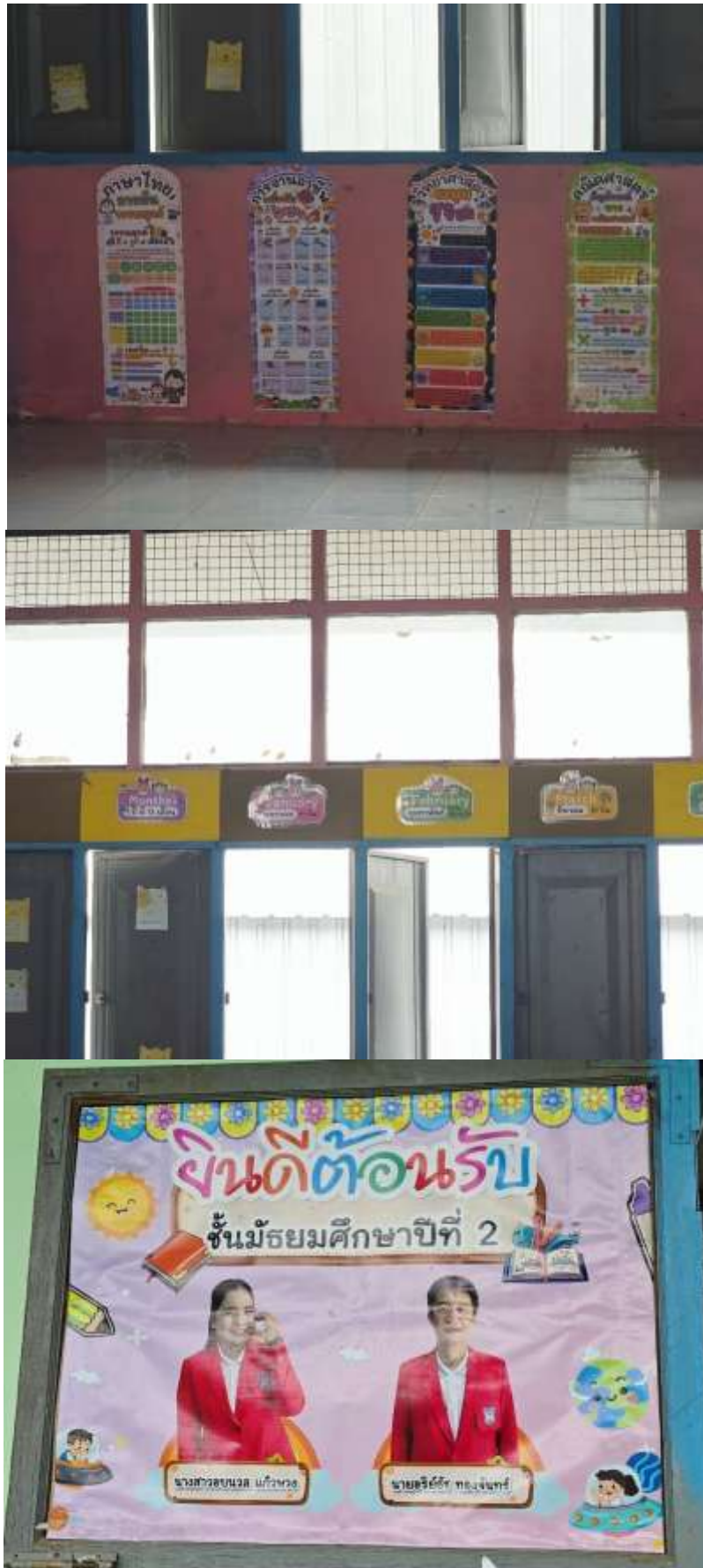
ภาพการจัดตกแต่งห้องเรียนให้มีสภาพแวดล้อมที่เอื้อต่อการเรียนรู้