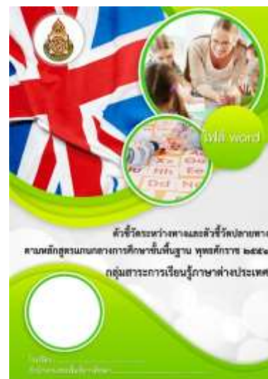
หลักสูตรแกนกลางการศึกษาขั้นพื้นฐาน