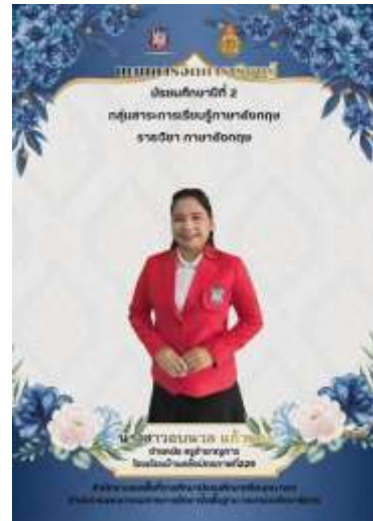
แผนการจัดการเรียนรู้