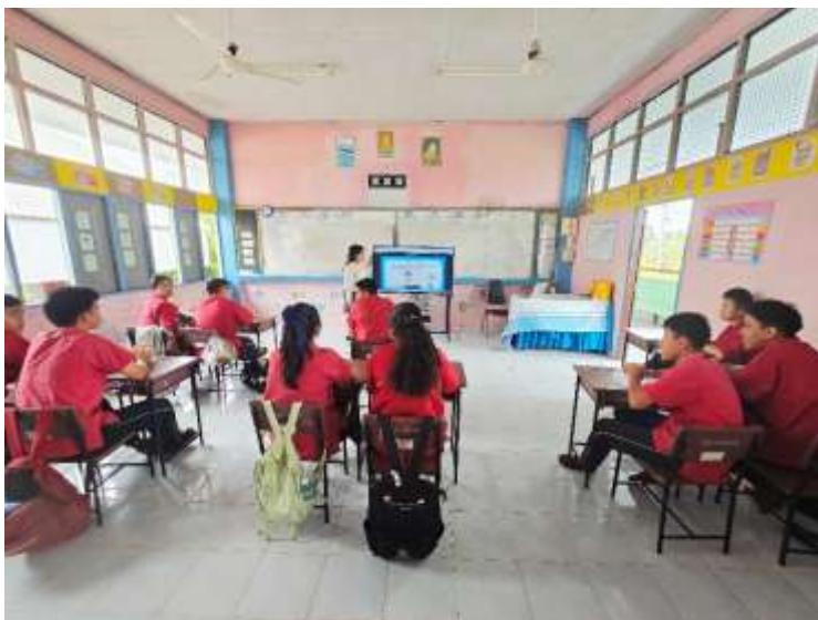
ภาพการใช้สื่อ เทคโนโลยีสารสนเทศ และแหล่งเรียนรู้ที่เอื้อต่อการเรียนรู้