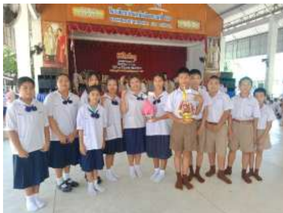
กิจกรรมวันไหว้ครู