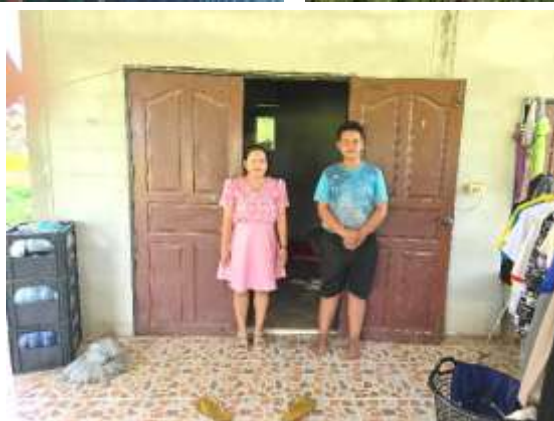
ภาพการให้ข้อมูลป้อนกลับแก่ผู้เรียนและผู้ปกครอง